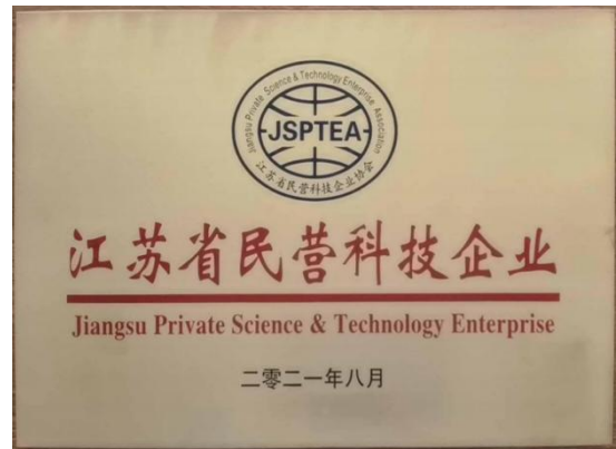
(b) 江苏省民营科技企业