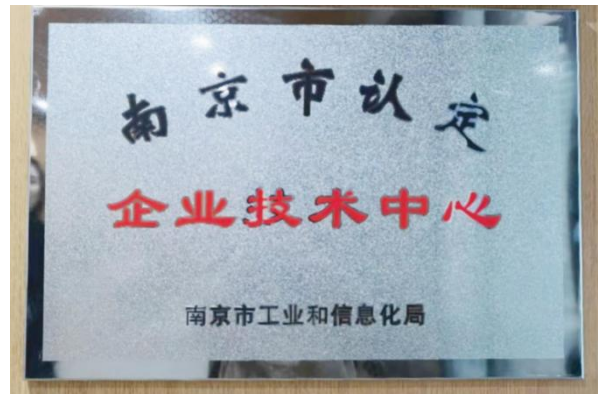
(d) 南京市企业技术中心