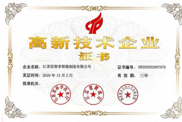
(a) 江苏省高新技术企业